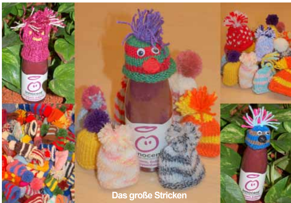
Das große Stricken

Es wurden von vielen fleißigen Strickerinnen insgesamt 1.648 Mütchen gestrickt. Für jedes gestrickte Häubchen gehen 30 cent an die Caritas "Wärme für ältere Menschen"